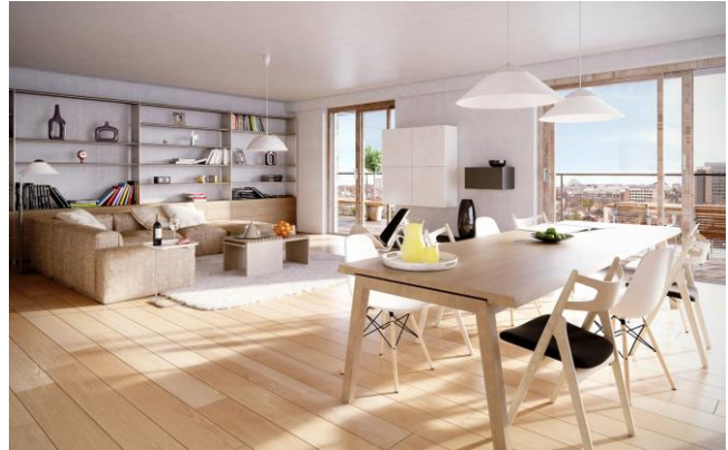
→ Livingstone I